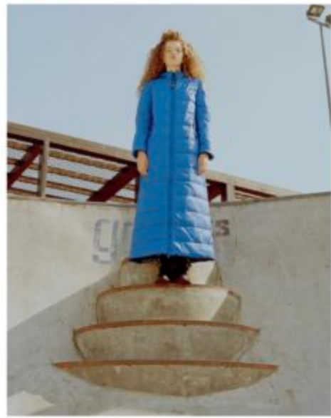
Пальто из полиэстера, 48 420 руб., Pinko ; кожаные ботинки, 30 990 руб., Perini (NO ONE) .