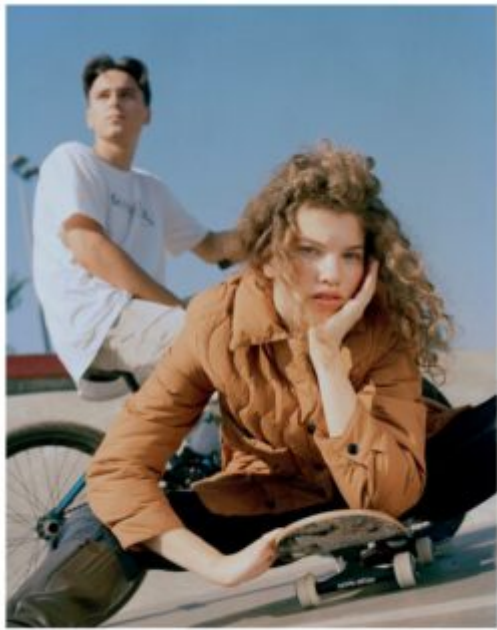
Куртка из хлопка и полиэстера, 7499 руб., джинсы, 2799 руб., все Mango ; кожаные сапоги, 18 990 руб., Mascotte .